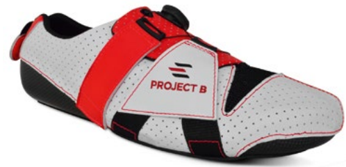
Modell 1: White-Red

Mail: info@waterline.nl Website: www.waterline.nl/de/