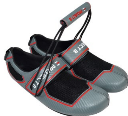
Modell 3: Gray

Preis: ab € 67,99 Mail: info@jlsport.de Website: www.rudershop.de