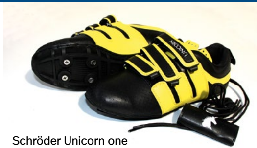
Schröder Unicorn one

Preise: SHIMANO-Bindungen ab € 165,00, SHIMANO-Ruderschuhe ab € 99,95.