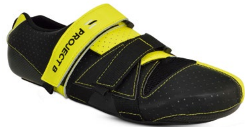
Modell 2: Black-Yellow